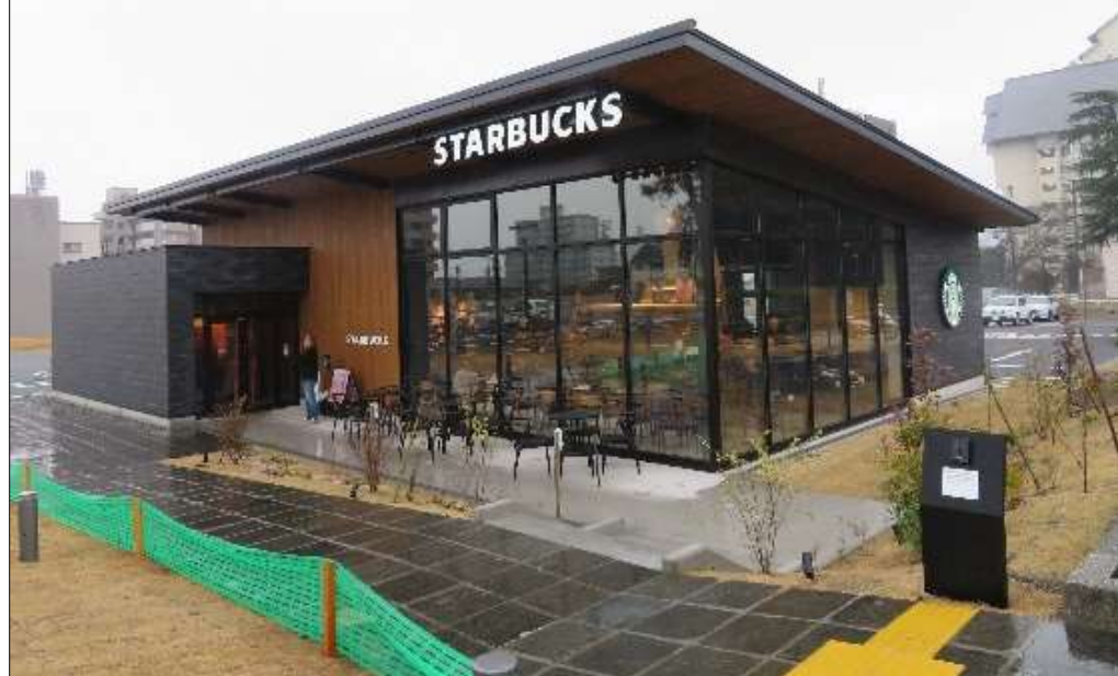
別府公園東駐車場公募施設整備(P-PFI)

日時 令和2年12月11日(金) 13時~(受付 12:30) 会場 ゲストルーム In Bloom Beppu (交流施設) 別府市西野口町 1-19 TEL 0977-80-1867 携帯 080-1717-7134