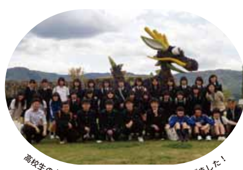
高校生の力で公園のイルミネーションを盛りあげました！

香川県立善通寺第一高等学校の生徒と教師がこれからのデザインについて共に学びながら、現実の社会の場でデザインが仕事になっていることの体験と、デザインの力で人々を幸せにしたいと思いながら取り組んだことを紹介します。