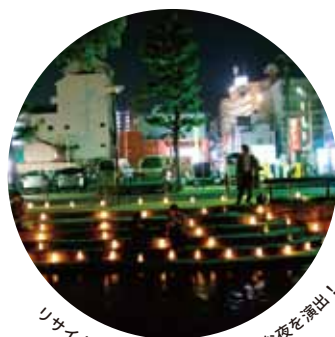
リサイクルしたキャンドルで素敵な夜を演出！

岡山市中心部に位置する西川緑道公園をまちの人に楽しんでもらいたい、という気持ちで始まった企画。2006年から毎年実施している西川キャンドルナイトでの取り組みを紹介します。