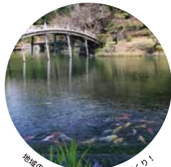
地域の方で特別名勝のにぎわいづくり！

特別名勝栗林公園の活性化を目的として地域の方々と組織した「栗林公園にぎわいづくり委員会」の活動を中心に、栗林公園の取り組みをご紹介します。