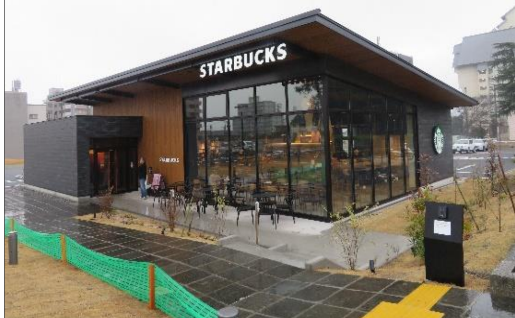
別府公園 南駐車場公募施設整備(P-PFI)

日時 令和2年4月24日(金) 13時00(受付12:30) 会場 ゲストルーム In Bloom Beppu (交流施設) 別府市西野口町1-19 TEL 0977-80-1867 携帯 080-1717-7134